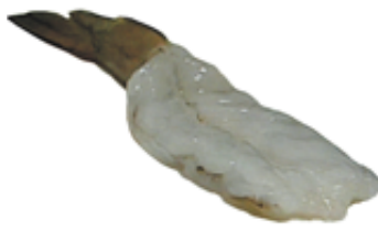
Cola-en la Mariposa