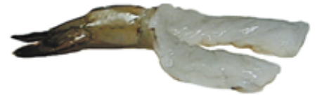
Cola-en Estilo Occidental