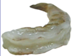
Pelado y Desvenado