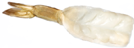
Con Cola Mariposa

Esta maquina peladora de camarón, compacta está diseñada para restaurantes, mercados de mariscos y otras operaciones de servicio de alimentos con espacio limitado.