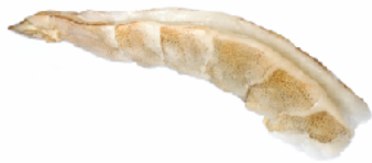
Completamente Pelado y Desvenado