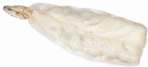
Completamente Pelado y Desvenado, Partido